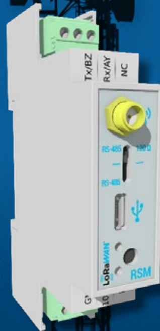
Maestro Modbus RS485