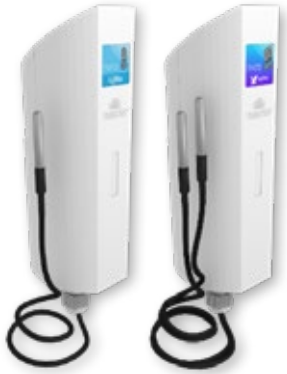
Sondas de temperatura