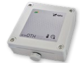
Sensores de Temperatura e Higrometría Outdoor