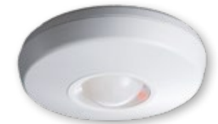
Detectores de presencia