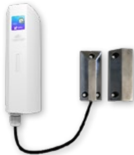
Detección de apertura y cierre