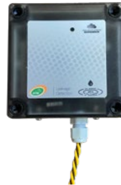
Fuga de líquidos