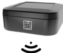
Nivel de llenado