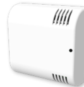
Sensor de calidad del aire