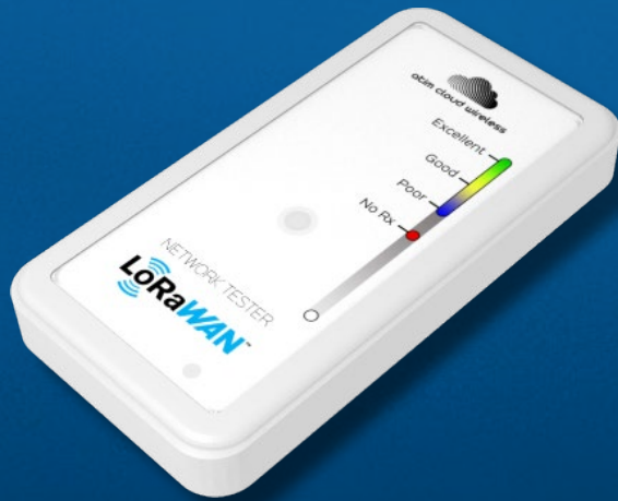
Testers de calidad de la red