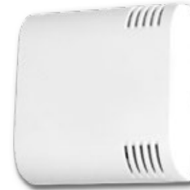
Sensores de Temperatura e Higrometría Indoor