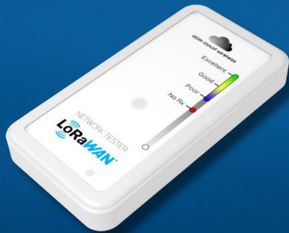
Testers de calidad de la red