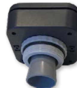
Nivel de llenado