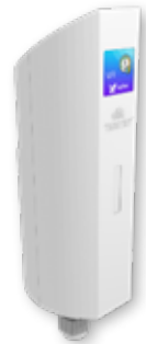
Contador de impulsos