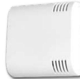
Sensores de Temperatura e Higrometría Indoor