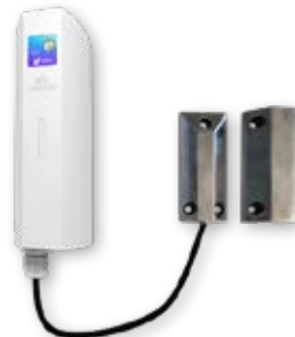
Detección de apertura y cierre