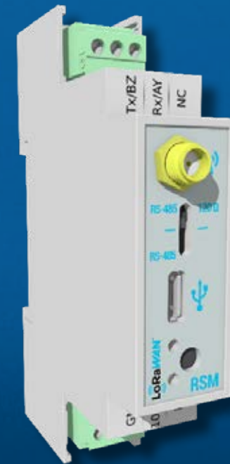
Maestro Modbus RS485