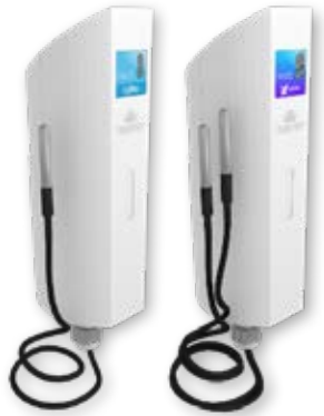
Sondas de temperatura