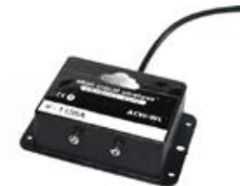
Fuga de líquidos