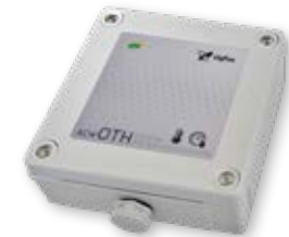
Sensores de Temperatura e Higrometría Outdoor